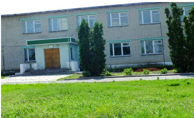
Филиал МБОУ Волчковской СОШ в с.Рахманино