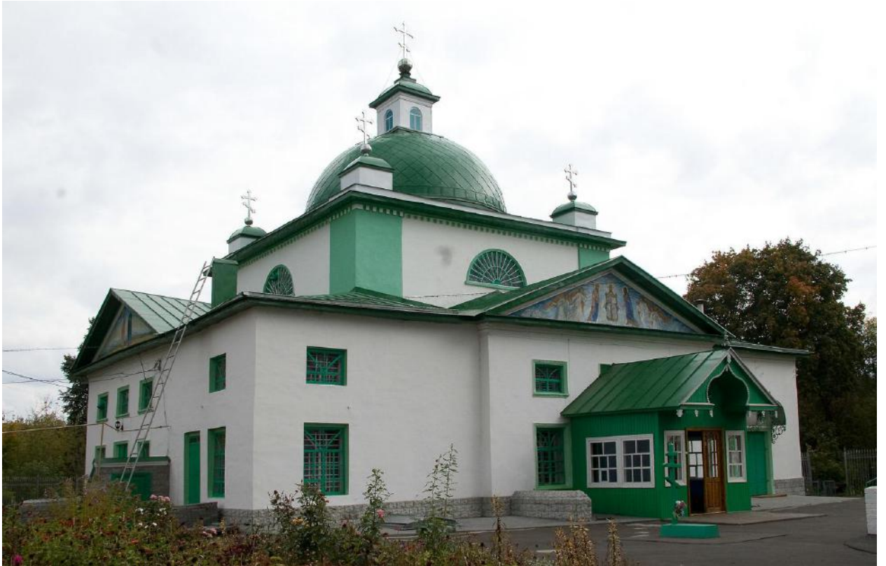
Усадьба Мара, родовая усыпальница дворян Баратынских