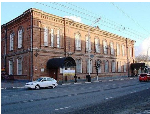
Казанский мужской монастырь