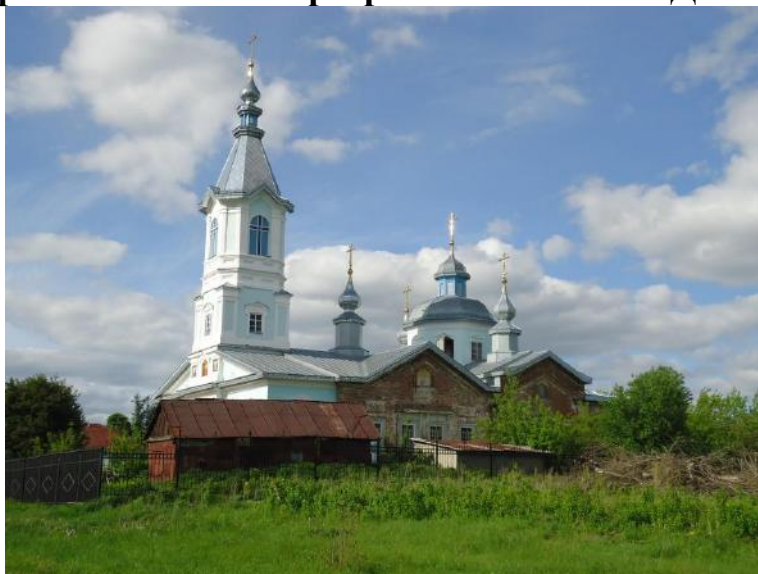
Церковь святых бессребреников Космы и Дамиана